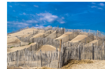
Les dunes du bord de mer